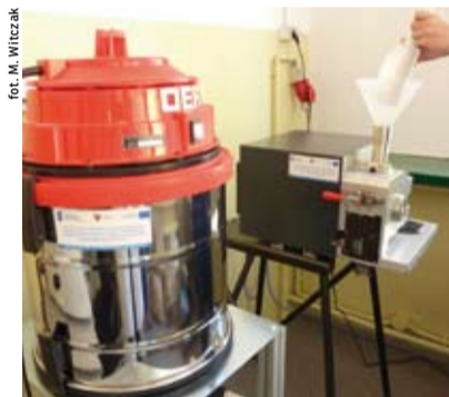
Młyn do rozdrabniania biomateriałów z cyklonem.