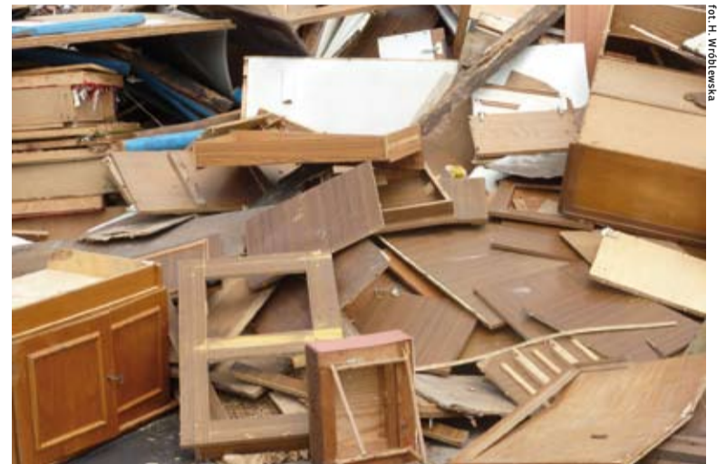
Bogatym źródłem drewna są wyeksploatowane i niepotrzebne, a więc wyrzucane, rozbierane i niszczone przedmioty zawierające w swym składzie drewno.