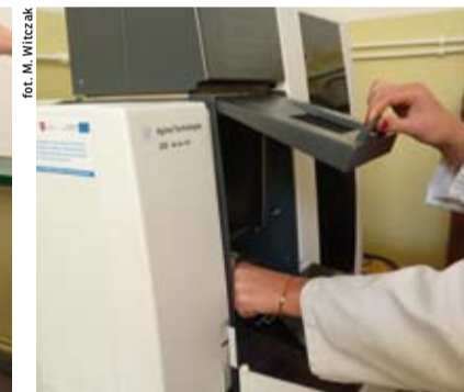
Spektrometr absorpcji atomowej.

Całkowita wartość inwestycji to 1 012 511,04 zł, natomiast kwota dofinansowania z Europejskiego Funduszu Rozwoju Regionalnego w ramach Wielkopolskiego Regionalnego Programu Operacyjnego na lata 2007-2013 wyniosła 685 104,39 zł.