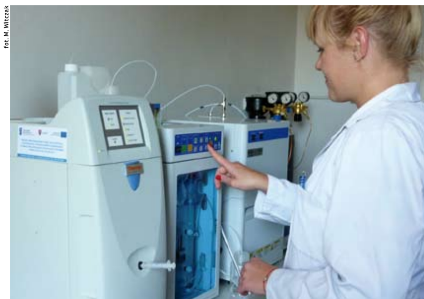
Urządzenie do chromatografii jonowej.

Pomocą w rozwiązaniu trudnego dla nas problemu stała się możliwość aplikowania o dofinansowanie modernizacji laboratorium ze środków Europejskiego Funduszu Rozwoju Regionalnego. Przygotowano projekt inwestycyjny, który został wysoko oceniony przez ekspertów. Z uzyskanych środków dofinansowano zakup zestawu urządzeń pozwalających na prowadzenie analiz pierwiastków uznanych powszechnie za niebezpieczne lub niepożądane w środowisku.