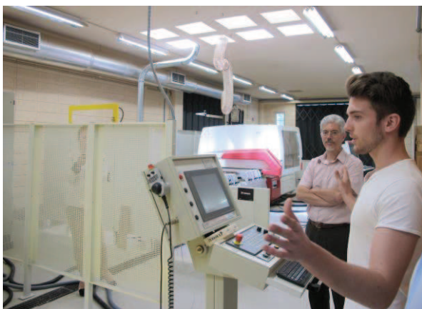
Visita a las instalaciones del CFPIMM.